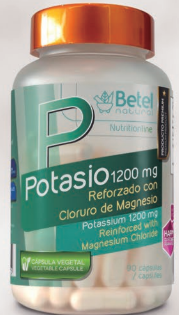
90 cápsulas 90 capsules

May help the nervous system and the contraction of the muscles. It can also help maintain a constant heart rate, bring nutrients to cells, expel toxins, lower blood pressure levels, and help prevent cerebrovascular disease.