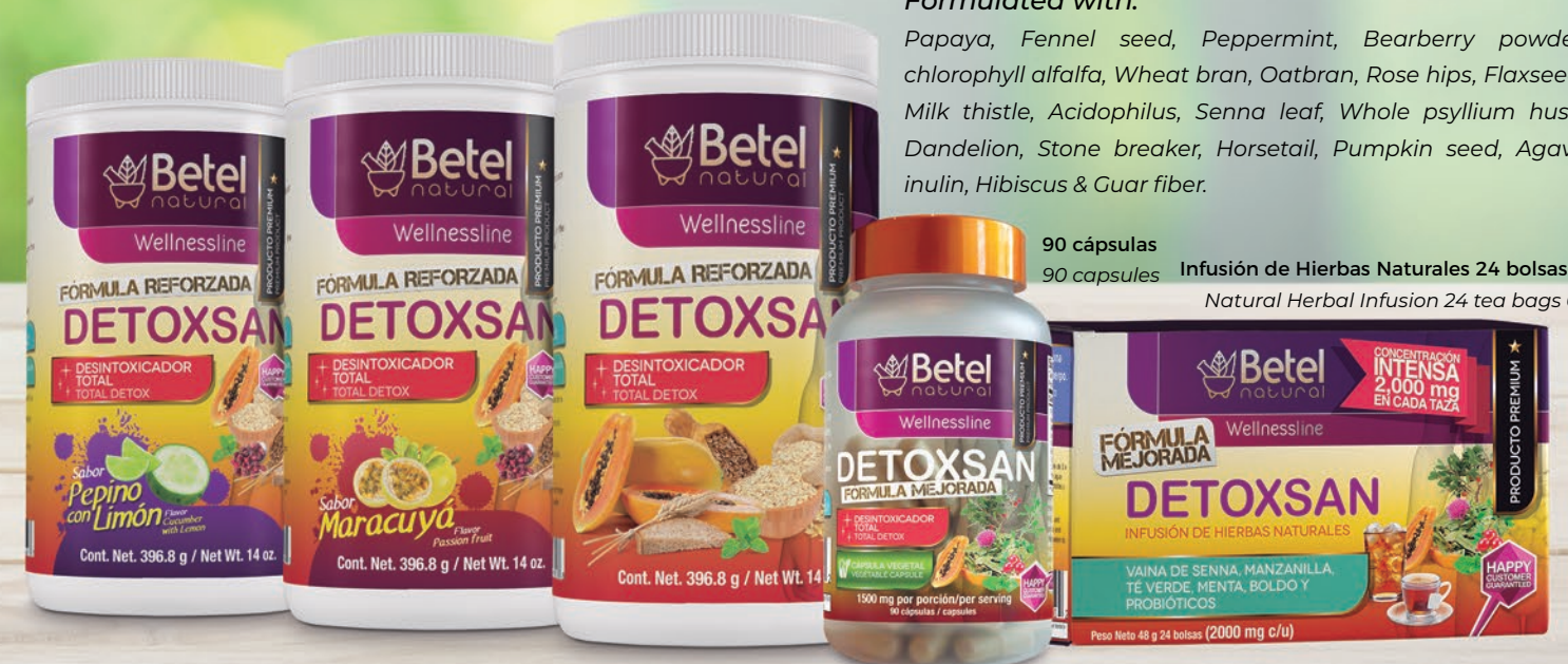
90 cápsulas Infusión de Hierbas Naturales 24 bolsas de 2 g 90 capsules Natural Herbal Infusion 24 tea bags 0.07 oz

Papaya, Fennel seed, Peppermint, Bearberry powder, chlorophyll alfalfa, Wheat bran, Oatbran, Rose hips, Flaxseed, Milk thistle, Acidophilus, Senna leaf, Whole psyllium husk, Dandelion, Stone breaker, Horsetail, Pumpkin seed, Agave inulin, Hibiscus & Guar fiber.