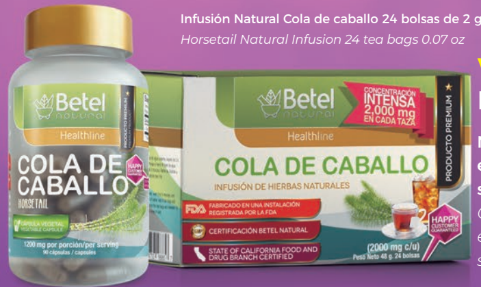
Infusión Natural Cola de caballo 24 bolsas de 2 g Horsetail Natural Infusion 24 tea bags 0.07 oz