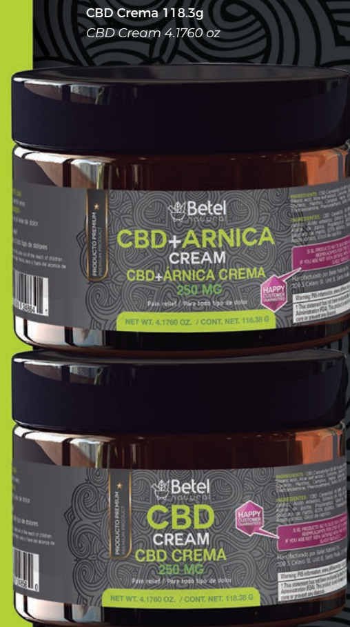
CBD Crema 118.3g CBD Cream 4.1760 oz

Our cream combines Arnica montana—renowned for its natural compounds that help relieve tension in muscles and joints—with high-purity CBD, crafted in the United States with the finest quality ingredients. Its lightweight, fast-absorbing texture offers a refreshing and calming effect on the skin, muscles, and nerves, supporting recovery from discomfort, impacts, or inflammation, and promoting an active, healthy lifestyle.