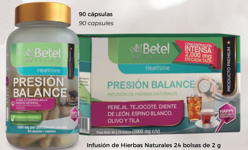
90 cápsulas 90 capsules