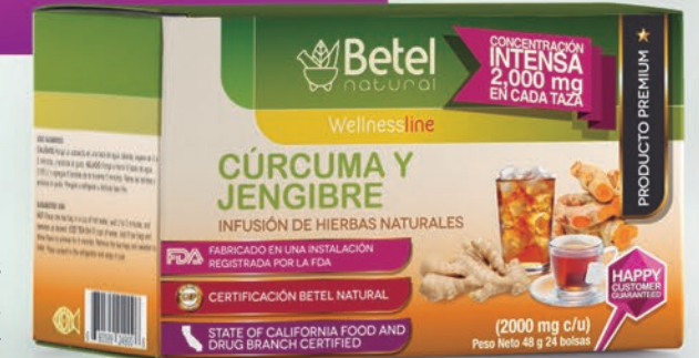
Infusión Natural de Cúrcuma y Jengibre 24 bolsas de 2 g Turmeric and Ginger Natural Infusion 24 tea bags 0.07 oz

Works as an anti-inflammatory and antimicrobial. It helps burn body fat, improves diabetes symptoms, and is believed to prevent cancerous tumors.