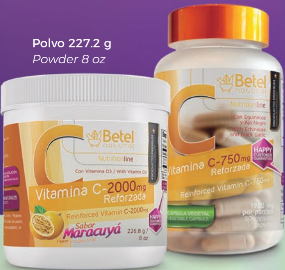
Polvo 227.2 g Powder 8 oz