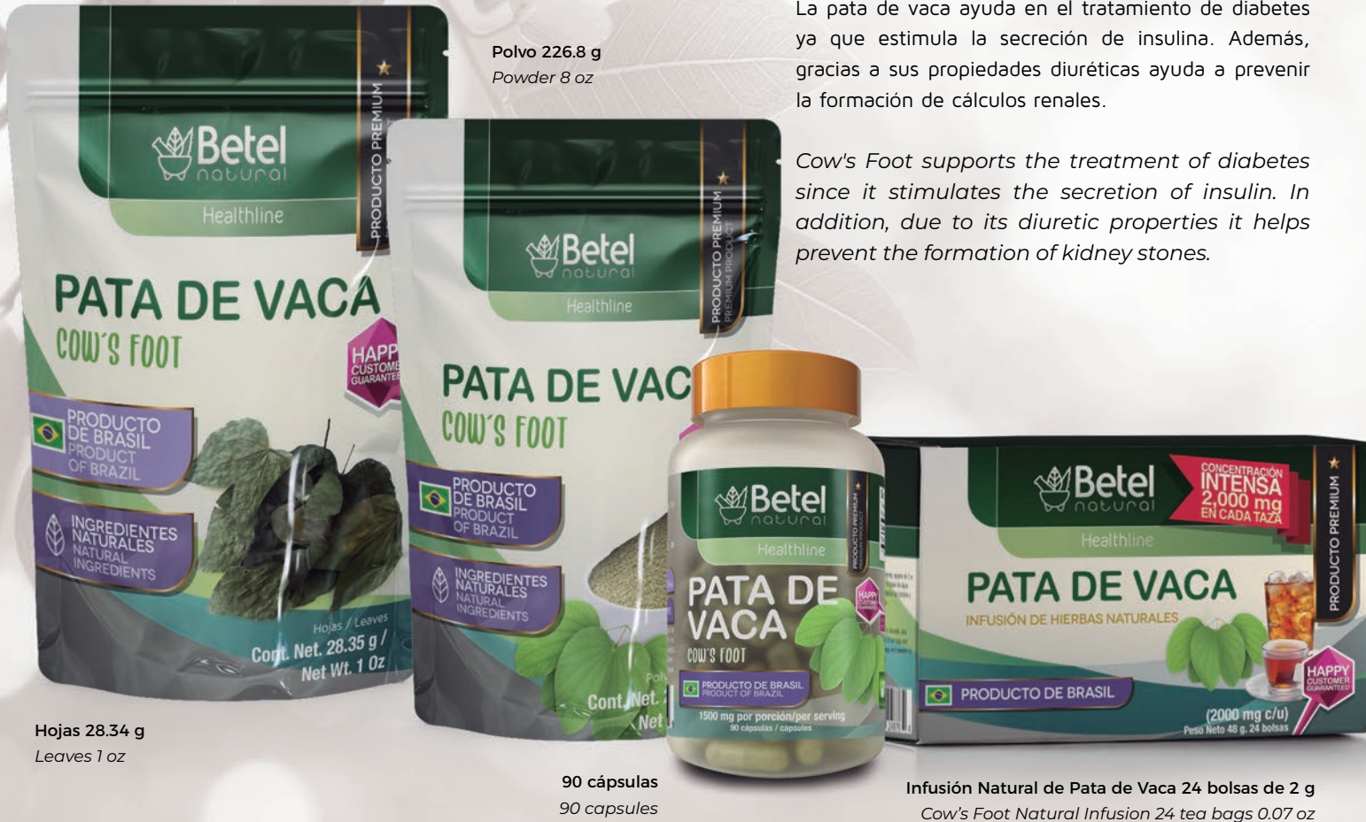
Polvo 226.8 g Powder 8 oz

Cow's Foot supports the treatment of diabetes since it stimulates the secretion of insulin. In addition, due to its diuretic properties it helps prevent the formation of kidney stones.