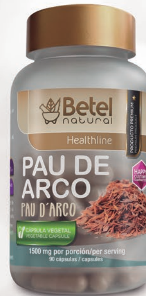
90 cápsulas 90 capsules

Parsley, Hawthorne, Dandelion, White Hawthorn, Olive & Linden flower.