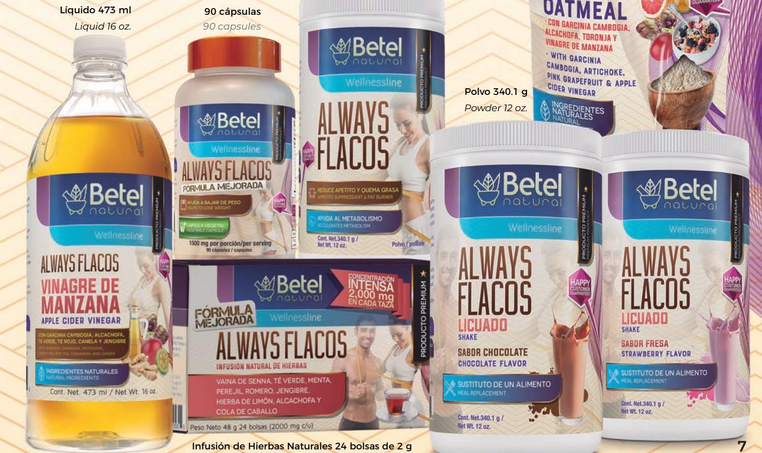
Líquido 473 ml / Liquid 16 oz.

Auxiliar en la pérdida de peso. Assists with Weight loss.