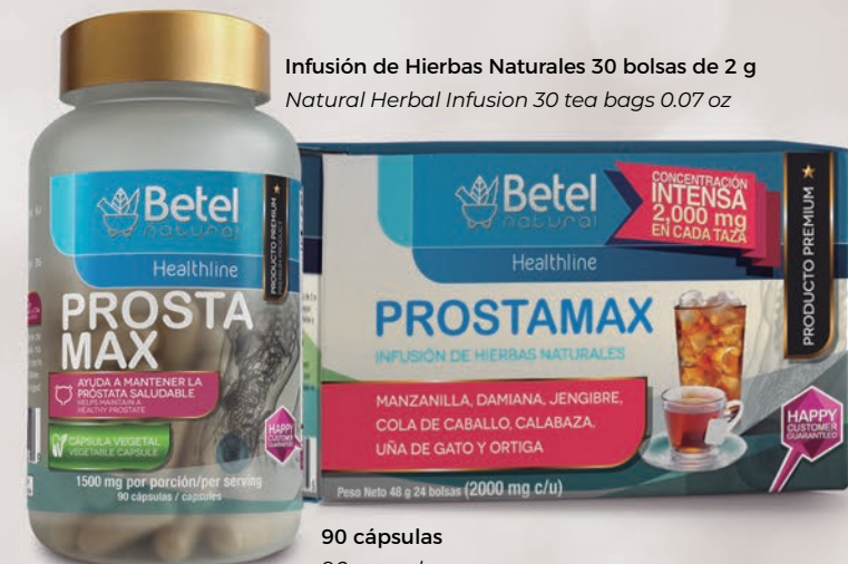
90 cápsulas 90 capsules