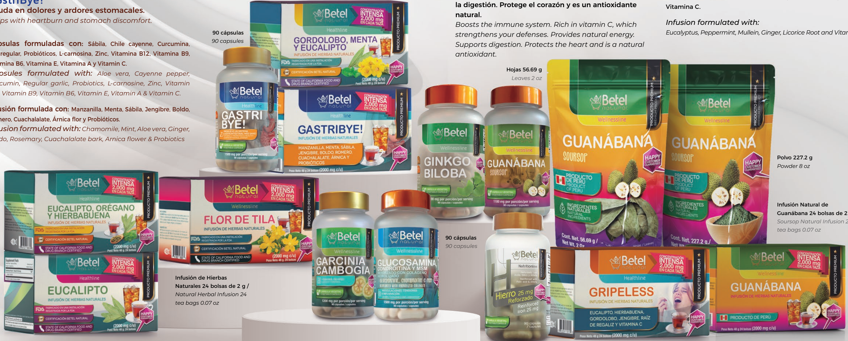
90 cápsulas 90 capsules

Eucalyptus, Peppermint, Mullein, Ginger, Licorice Root and Vitamin C.